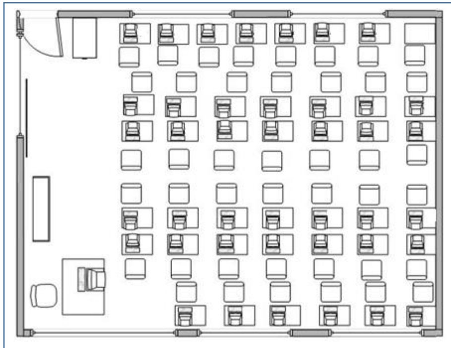
Imagen de distribución N° 3