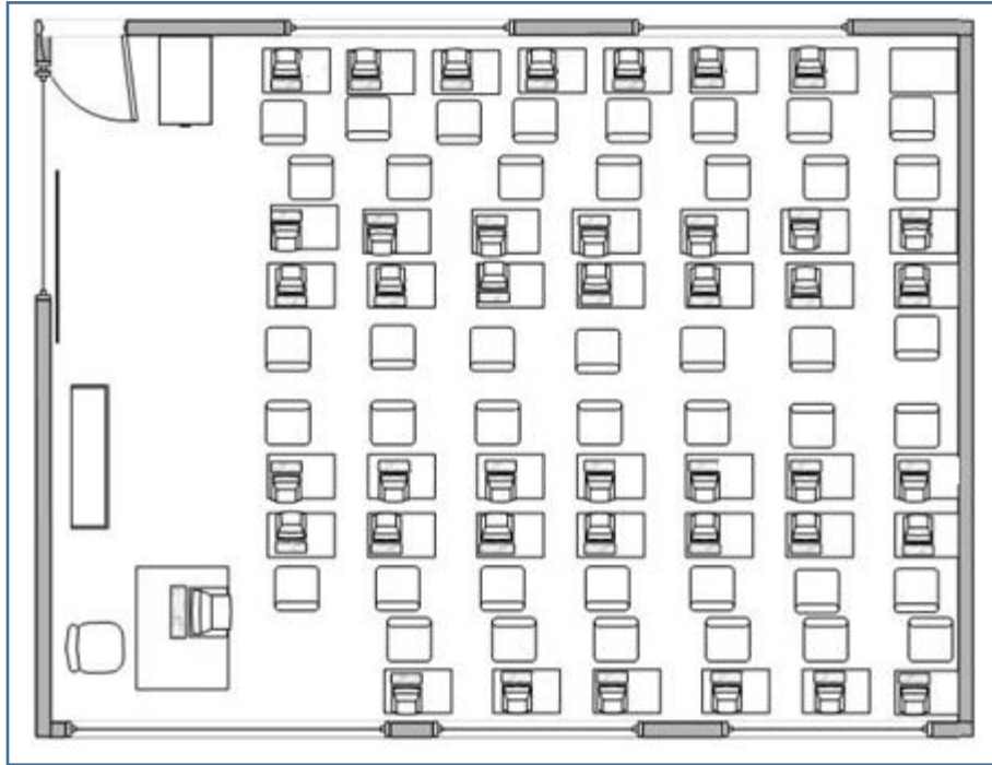
Imagen de distribución N° 3