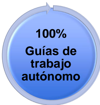
Figura 2. Distribución porcentual para la calificación final de las asignaturas de educación cívica, psicología y ética profesional

2.1. Para la persona estudiante que no logre el porcentaje mínimo antes indicado, la persona docente a cargo de la asignatura, aplicará al finalizar el segundo periodo del curso lectivo 2020, una estrategia de promoción, cuya realización permitirá la promoción final. Una vez aplicada la misma, la persona docente elaborará un segundo informe descriptivo de logro de cierre de condición, el cual detallará la condición final de promovido en la respectiva asignatura. La estrategia de promoción se desarrollará según las disposiciones administrativas y académicas particulares que se establezcan para este fin.